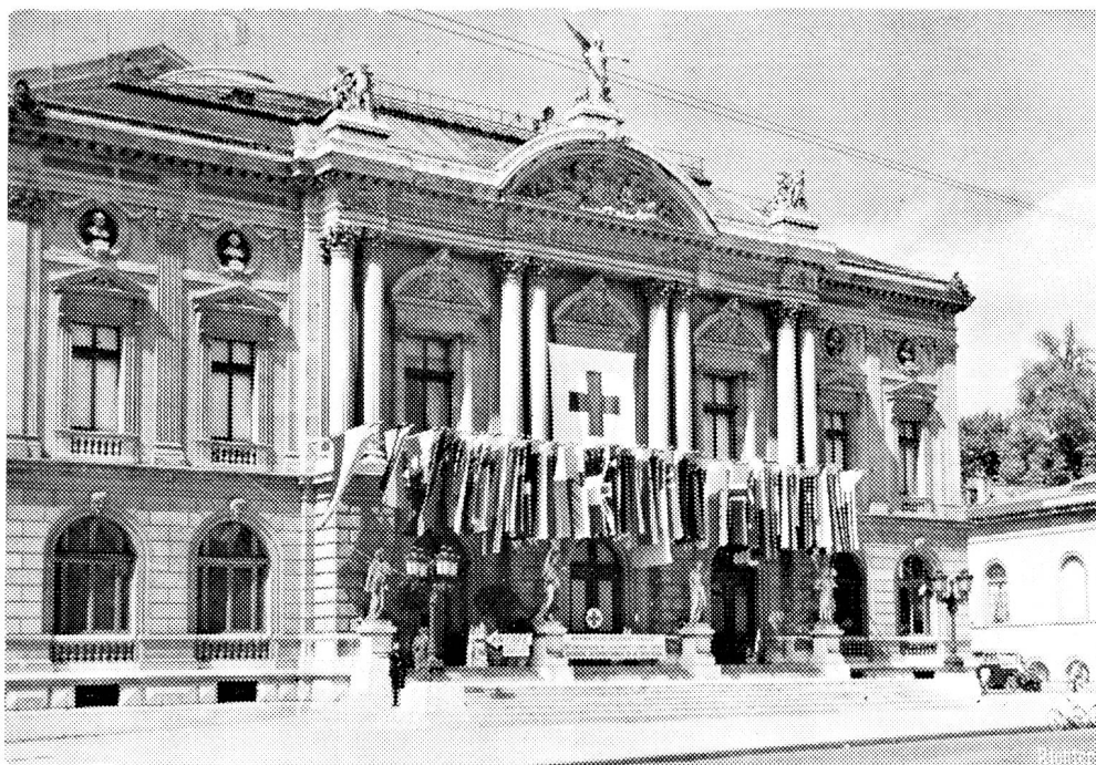
L'Exposition de la Croix-Rouge au Grand-Théâtre de Genève.

Dunant ne s'est pas borné à éveiller avec une émotion communicative les sentiments de compassion qui sommeillent plus ou moins profondément dans le cœur de beaucoup d'hommes. Il a réussi à convaincre les souverains d'alors et les gouvernements qu'il fallait apporter un remède aux souffrances causées par les conflits armés. Il a aussi, avec la Société genevoise