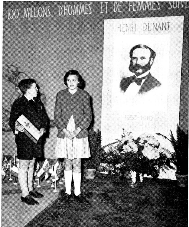
Les deux «juniors» zuricois à qui leurs camarades allemands ont confié le soin d'apporter à Genève le témoignage de la Croix-Rouge allemande devant le portrait d'Henri Dunant à l'Exposition internationale de la Croix-Rouge. Le jeune garçon semble présenter au fondateur de la Croix-Rouge le message qui lui a été confié à la frontière allemande.

C'est cette tendance qui continue à s'affirmer aujourd'hui et qui demeure, comme elle le fut aux débuts de l'œuvre, le ressort essentiel de toutes les conventions dont est venue s'enrichir l'action humanitaire de la Croix-Rouge. Il y a là, dans le domaine particulier du droit des gens, une innovation remarquable et dont l'honneur remonte au fondateur de la Croix-Rouge et de son idée maîtresse.