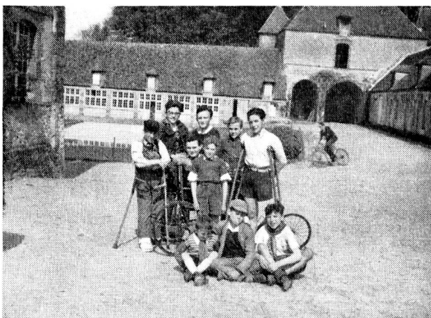
Un groupe d'enfants en traitement de réadaptation aux Mesnuls.

Le bâtiment était trouvé, mais une somme importante était encore nécessaire pour transformer ce château en un Centre de réadaptation pour infirmes. Il manquait une salle de massages, avec ses appareils de mécanothérapie, des classes et des ateliers de formation professionnelle. Grâce à l'appui financier de divers organismes privés et de quelques personnalités, Villepatour put ouvrir ses portes en mai 1947.