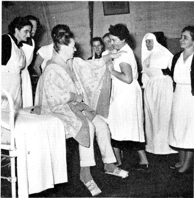
Confection d'une robe de chambre improvisée.