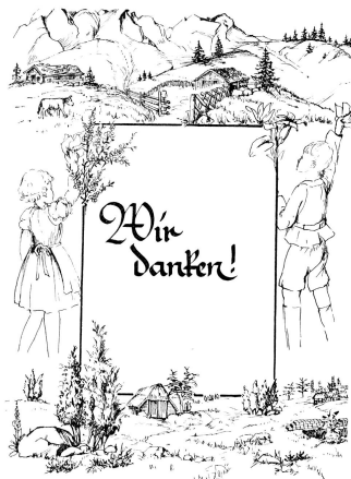
Les enfants de Meppen, en Hesse, qui ont été accueillis dans des familles suisses ont envoyé à la Croix-Rouge suisse une belle adresse de gratitude.

En plus, 32 enfants, qui avaient été recrus en préventorium, ont été transférés en sanatorium.