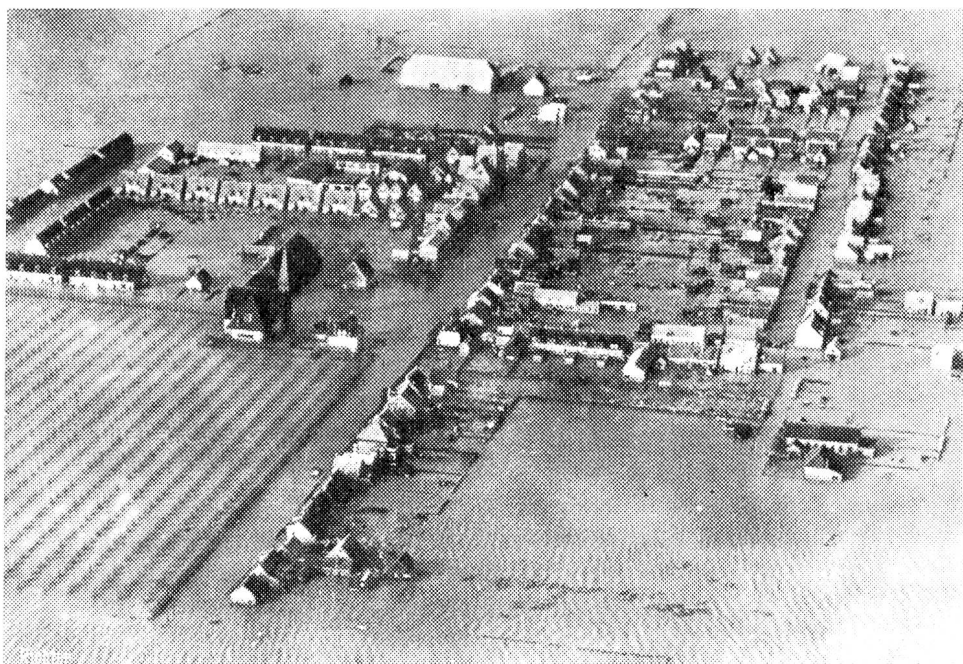
Un sixième de la superficie totale des Pays-Bas est sous l'eau. Voici le petit village de Moerdijk perdu dans les flots.

2 février 1953. L'annonce d'un nouveau désastre. L'eau encore est la cause du cataclysme. Mais ce n'est plus de la neige ni de la glace descendues des sommets, mais ce n'est plus de l'eau douce et lourde d'un grand fleuve que naît la catastrophe. La mer, cette fois, s'est ruée à l'assaut des côtes néerlandaises et britanniques. La rencontre aussi malheureuse qu'imprévisible d'un cyclone d'une violence rare sous nos climats et des