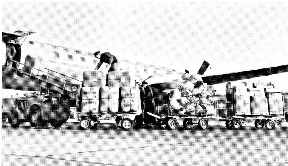
A l'aéroport de Cointrin, un avion d'une compagnie néerlandaise charge une importante cargaison de couvertures de la Croix-Rouge et de vêtements récoltés en Suisse pour les sinistrés des Pays-Bas.

La réponse de notre pays fut admirable de tous points et il sied d'en remercier la population suisse toute entière qui a si largement et rapidement répondu aux appels tant de la Croix-Rouge suisse que de la Chaîne du bonheur, de Caritas et de tant d'autres généreux intermédiaires. La Société suisse de radiodiffusion, le 9 février, remettait officiellement au Palais fédéral, aux ministres des trois pays sinistrés une première somme d'un montant de deux millions souscrits par les abonnés des téléphones suisses en réponse