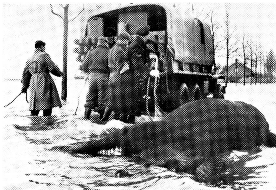
Participant aux secours, des pontonniers français dégagent le cadavre d'un cheval.

Il faut souligner aussi et d'abord le travail accompli dans les trois pays sinistrés par leurs Croix-Rouges nationales. Depuis l'aube tragique de ce 1 er février où fut décrété l'état d'alarme, dans les trois pays frappés, des milliers d'hommes et de femmes, voire d'enfants, volontaires de la Croix-Rouge, parmi lesquels un grand