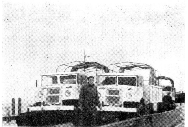
Deux camions du C. I. C. R. ont été placés sur le bac qui va les conduire à pied d'œuvre.

Les camions du C. I. C. R. rentraient également à Genève le 14 février, ayant utilement collaboré avec leurs chauffeurs aux travaux de sauvetage et à la réfection des digues.