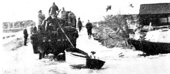
Suivant les indications transmises par radio d'un hélicoptère, un char amphibie américain a pu recueillir une famille de paysans hollandais sinistrés et rejoint la terre ferme à Oosterland.

20 janvier 1951, 12 février 1951. Les avalanches qui se sont abattues sur les hautes vallées alpestres ont fait en Suisse, en Autriche, en Italie, de nombreuses victimes et entraîné des millions de dégâts. Un élan magnifique et unanime a soulevé la Suisse et l'Europe entière, l'aide aux sinistrés de la mort blanche restera une des nobles pages de l'histoire de la charité humaine.