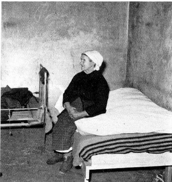
On a repoussé le vieux lit, le petit dormira bien ce soir dans le grand lit tout neuf.

Des dizaines et des dizaines, et pour un seul district quand tant d'autres attendent eux aussi leur tour. Seuls des parrainages pourront nous permettre de poursuivre la tâche commencée, beaucoup de parrainages et beaucoup de bonnes volontés. Quatre souscriptions à des parrainages de dix francs par mois pendant six mois permettent d'acheter un lit complet et sa literie, c'est dire qu'il faudra beaucoup de parrainages pour que l'on puisse donner assez de lits à ceux qui, chez nous aussi, en manquent... T.