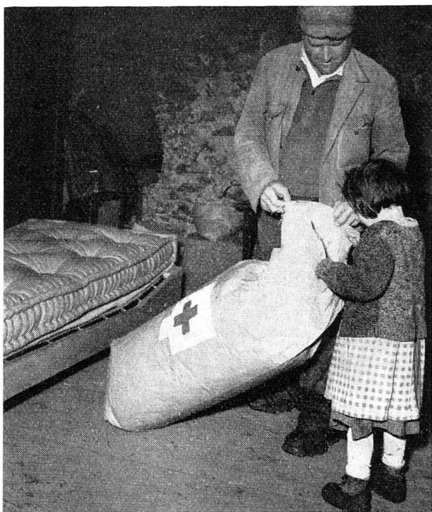
L'arrivée d'un lit de la Croix-Rouge

Comment une telle initiative allait-elle se matérialiser et quelle forme allait prendre l'aide de notre Croix-Rouge nationale aux enfants malheureux de notre pays? La formule des parrainages parut d'entrée être celle qui permettrait le mieux de répondre aux besoins et d'intéresser le plus largement possible notre population à une telle œuvre d'entraide. D'après,