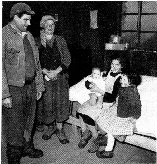
Pour dormir, cette famille de cinq personnes n'avait que deux lits jusqu'à présent.

Dans ces deux foyers là, dans tant d'autres qui leur ressemblent, ce nouveau lit, avec son cadre de bois et son sommier métallique, son solide protège-matelas et son matelas, ses draps, sa couverture de douce laine peignée, le gros édredon recouvert de sa housse quadrillée de rouge et de blanc et son oreiller houssé de même, quelle transfiguration, soudain! Et puis cette joie très discrète, très silencieuse chez