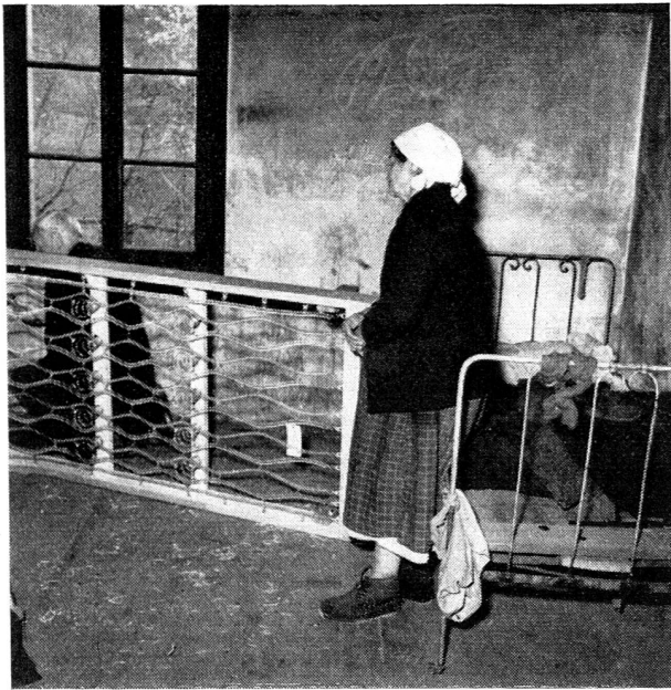
C'est dans le «lit» de droite qu'un enfant dormait sur des planches, avec des chiffons pour draps et couverture...

d'autre part, les enquêtes et les constatations faites, l'aide qui apparaissait à la fois la plus nécessaire et la mieux conforme au but poursuivi et aux activités de la Croix-Rouge suisse, serait, au début en tous cas, la fourniture de lits ou de literie à des enfants appartenant à des familles particulièrement privées de ressources et qui seraient signalées soit par nos propres sections et leurs déléguées sociales, soit par l'intermédiaire d'autres œuvres d'assistance publiques ou privées. C'est enfin dans les régions particulièrement déshéritées de la Confédération, où les œuvres d'assistance régulière sont aussi et par contre-coup les moins à même de secourir efficacement tous les cas signalés, c'est-à-dire d'abord dans les régions et les cantons alpestres , que notre aide s'exercerait. Nos parrainages seront donc au premier chef une action d'entraide confédérale puisque la majorité des parrainages recueillis le seront dans les régions et les cantons les plus favorisés et que l'aide apportée ira à des Confédérés moins bien partagés par le sort.