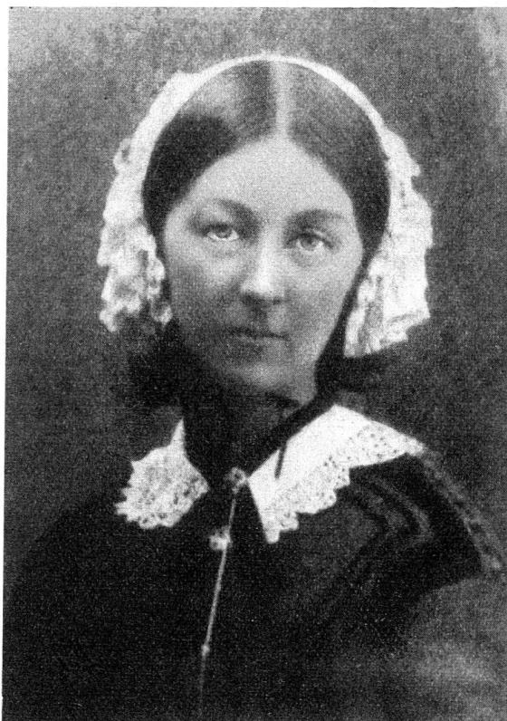
Florence Nightingale en 1856

titution de Saint-Loup. C'est, en 1859, la fondation à Lausanne par la comtesse de Gasparin, née Boissier-Butini, de l'école de gardes-malades indépendantes de la Source, qui est aujourd'hui la plus ancienne du monde. C'est encore la création, dans le canton de Schwyz, de l'institution des religieuses d'Ingenbohl célèbre dans l'Europe entière.