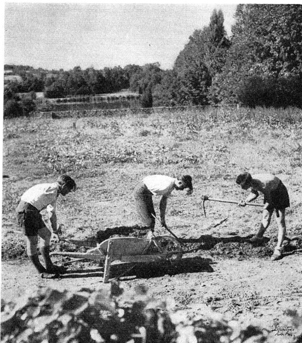
Travaux des champs aux Mesnuls, les trois petits jardiniers ont tous trois perdu un bras.

Or il est très difficile d'obtenir, de la part de l'enfant, cet effort. Ayant souvent acquis une grande agilité sans appareil ou avec l'aide seulement de béquilles, il n'aime pas ce dispositif qui le gêne et le