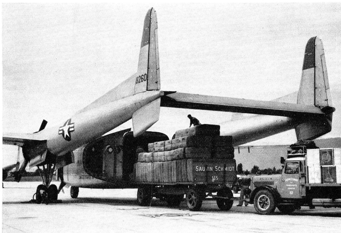
Six cargos de l'armée de l'air américaine ont chargé à l'aéroport de Cointrin les dons des Croix-Rouges canadienne, luxembourgeoise, nord-américaine, sud-africaine et suisse centralisés par la Ligue et destinés au Pakistan.

pour renforcer son réseau d'aide internationale aux victimes de cataclysmes. Elle lança, au su de ces catastrophes successives, appel sur appel aux sociétés nationales de Croix-Rouge. Un grand nombre d'associations répondirent généreusement et sans tarder. Des tentes, des couvertures, de la literie, des vêtements, des vivres et des médicaments furent envoyés de partout par avion sur les lieux des catastrophes et per-