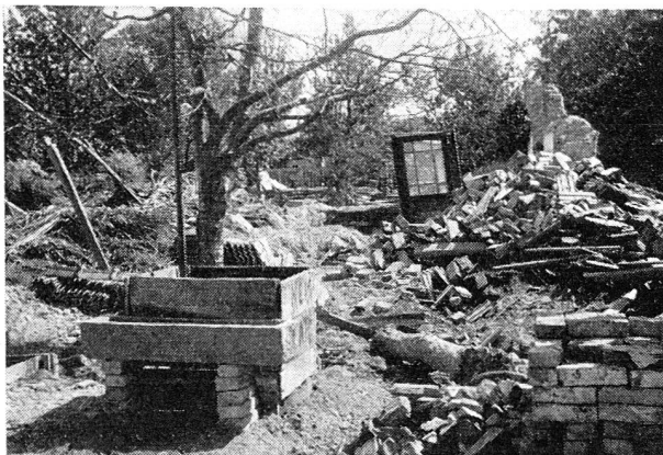
La ville de Győr, en Hongrie a été dévastée par les inondations en dépit des digues élevées en hâte par les habitants.

Le président et le secrétaire général de la Ligue s'étaient adressés aux Croix-Rouges suédoise, néerlandaise et suisse en les priant de mettre à disposition de l'organisme international de leurs propres collaborateurs afin de participer avec les représentants de la Ligue aux