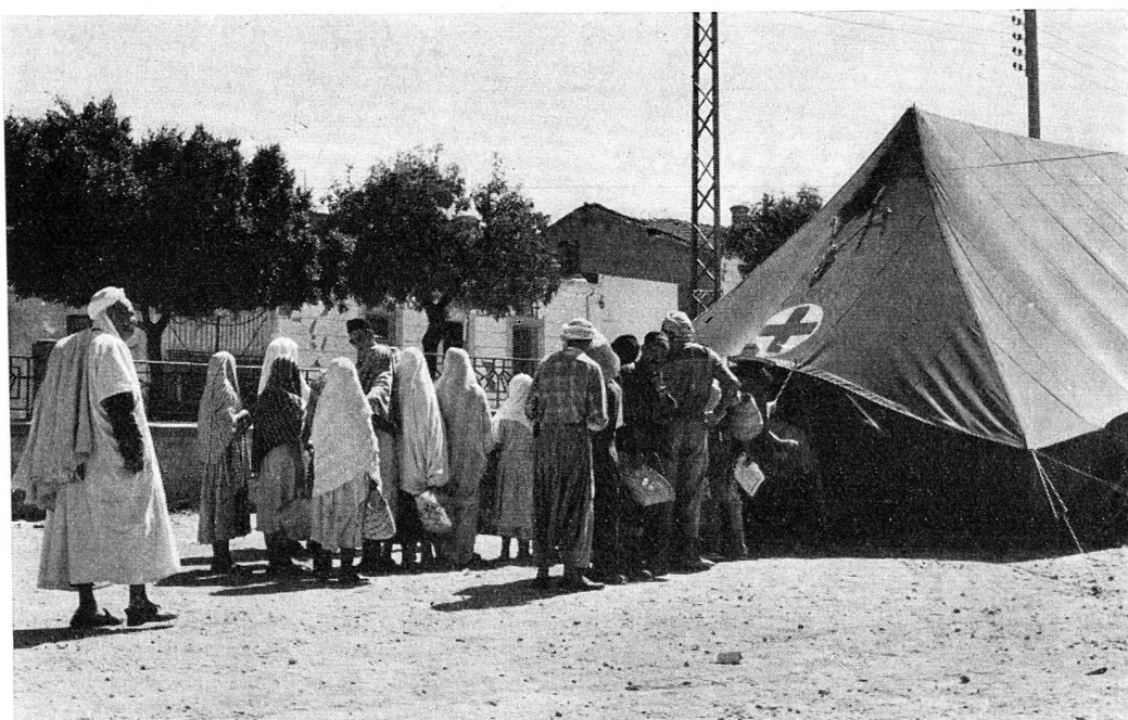
La Croix-Rouge française a installé pour les sinistrés d'Orléansville de nombreuses tentes. Vivres et médicaments sont distribués par ses soins à la population. Voici des Arabes venant se ravitailler à l'une de ces tentes.

Ces médecins et infirmières travailleront à l'hôpital universitaire de Taegu durant environ quinze mois, soit jusqu'à la fin de 1955. Ils sont