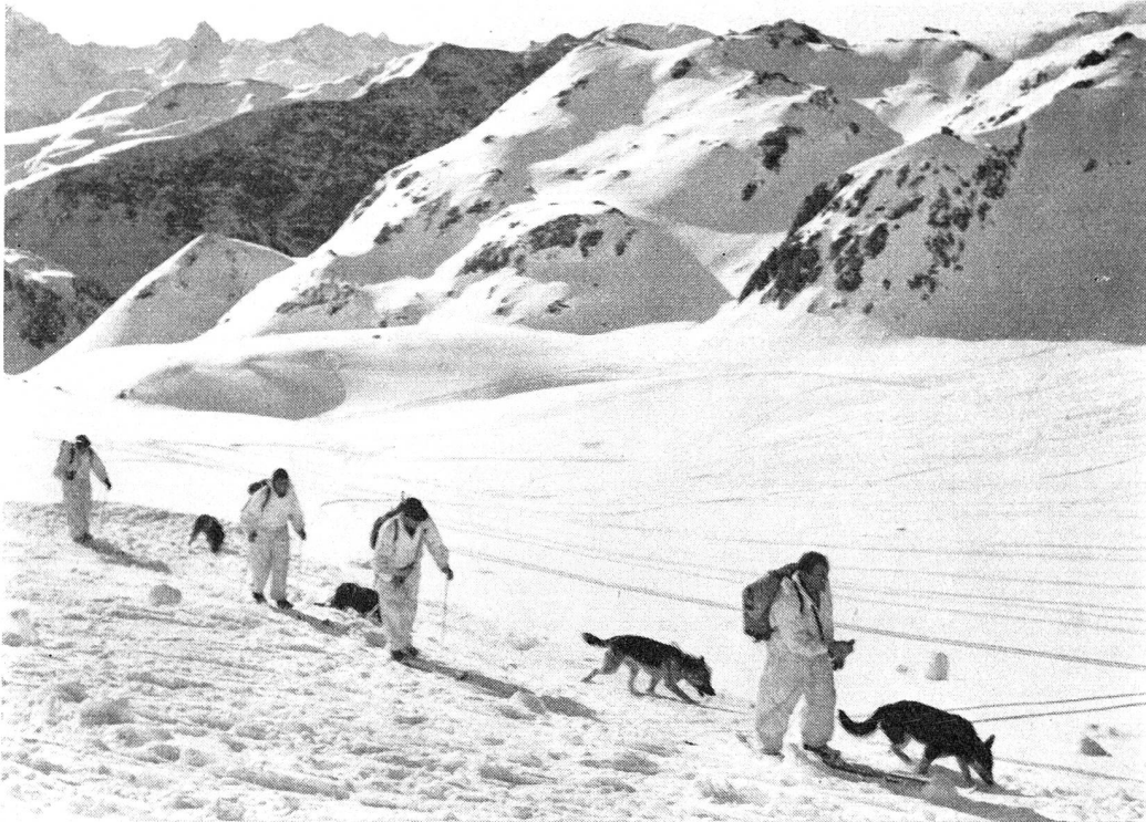
Un cours de conducteurs et de chiens d'avalanches.

par deux hommes, soit muni d'une roue; le «traîneau Akja», en aluminium, couramment utilisé en Autriche ou en Allemagne, un peu plus lourd que la «canadienne» classique (13 à 14 kg au lieu de 10), mais qui a l'avantage de pouvoir être transporté en deux parties au lieu de l'accident et, conduit par deux skieurs voire par un seul, de protéger le blessé de la neige grâce à ses bords relevés, et que l'on peut également placer sur un léger chariot à une roue; le «téléphérique» enfin, selon le modèle que possède déjà notre armée, et qui avec ses trois câbles porteurs de 100 m de long, son câble tracteur