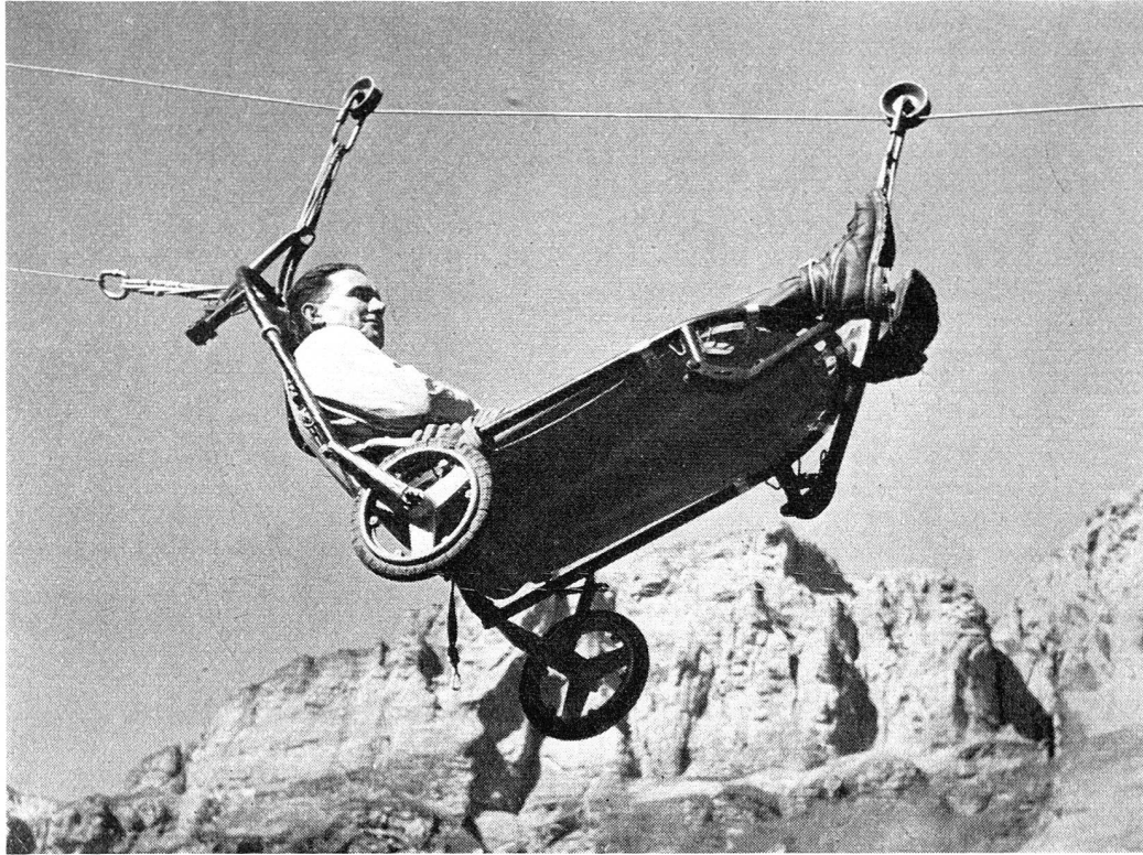
Descente d'un blessé en téléphérage sur câble.

Puis des religieux vinrent, aux alentours de l'an mille, s'installer sur ces hauts passages. L'œuvre admirable accomplie à l'appel de saint Bernard de Menthon au Grand- et au Petit-