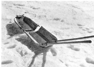
La luge «Akja» en aluminium pour le transport des blessés.