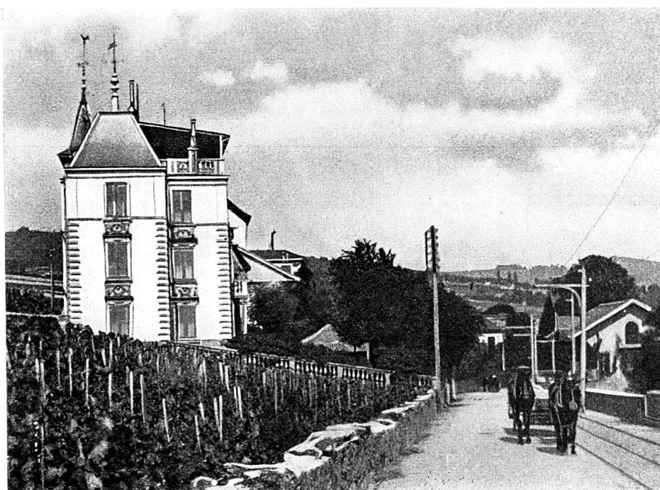
Le premier asile, la Villa Romaine à Pully (1901 - 1910)