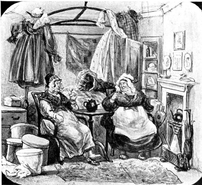
« Infirmières » de jadis!