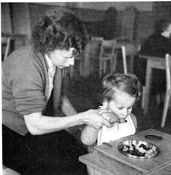
Apprendre à l'enfant à manger seul demande de la patience. Une planchette spéciale y aide. La mère guide d'abord la main de l'enfant.

Suivant la localisation de ces lésions, certaines parties du corps sont atteintes de paralysie crispée , ou d' athétose ; on constate en