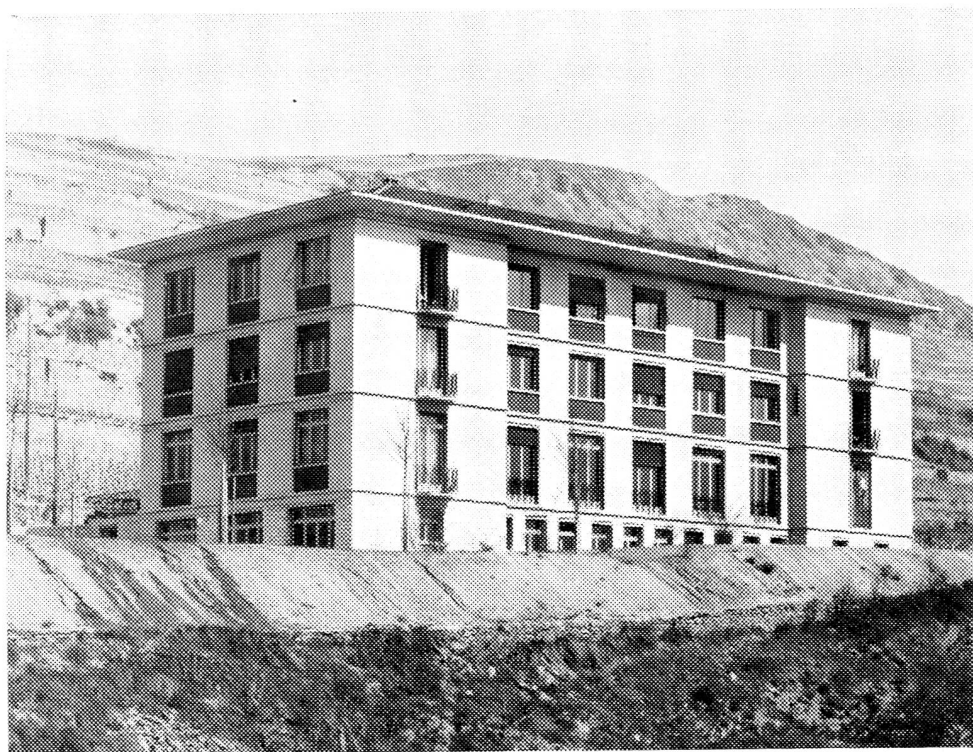
Le nouveau bâtiment de l'Ecole valaisanne d'infirmières à Sion inauguré le 30 avril

Le déséquilibre croissant entre les besoins et l'offre. Celle-ci n'est pourtant pas en recul. Au contraire. Le nombre des élèves étudiant dans