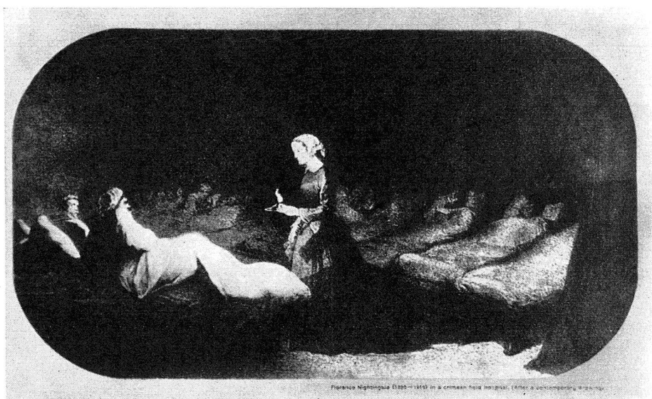
La dame à la lampe, Florence Nightingale en Crimée (1854)

Il faut bien reconnaître que la profession d'infirmière commence seulement, chez nous, à devenir une profession dans le sens propre du terme. La situation matérielle et sociale n'est pas encore parvenue, malgré les grands progrès réalisés ces dernières années, au niveau qu'elle doit atteindre. C'est à résoudre les problèmes que cela pose que travaillent ensemble les associations d'infirmières comme la VESKA et la Croix-Rouge suisse. Formation, perfectionne-