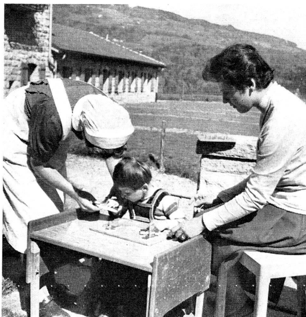
De simples jouets de bois, une caisse de sable sont les meilleurs auxiliaires de la rééducation des membres.

A côté de ce travail d'éducation, qui revêt un aspect plus spécialisé, il y a, tout aussi importante, l'occupation des loisirs. Dans ce do-