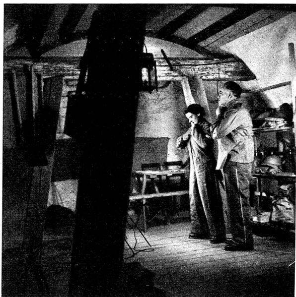
L'alarme avions a été donnée, les gardes d'immeuble gagnent leur poste et s'équipent.

l'évolution formidable de l'aviation, et de la puissance de destruction des armes contemporaines, un aspect « total » dont l'histoire n'offre pas d'exemple. Elle constitue une menace considérable pour la population civile tout entière. Il ne faut pas oublier assurément que la « technique » de la guerre demeure subordonnée à l'utilisation de ces terribles moyens par des hommes et que ces hommes en porteront, eux, l'entière responsabilité. Nous ne devons donc jamais cesser de nous élever contre de telles utilisations qui englobent aveuglement la population civile et de demander leur proscription. Mais nous devons prendre en même temps, dans le cadre de notre défense nationale, toutes les mesures nécessaires pour assurer la protection des civils en cas de guerre et réduire au minimum les pertes de vies humaines et de biens matériels. La Croix-Rouge ne peut se désintéresser de ce devoir. Depuis Solférino, notre tâche s'est considérablement élargie. Nous ne pouvons plus nous limiter à ne secourir que les soldats blessés et malades, nous devons étendre notre aide à toutes les victimes de la guerre.