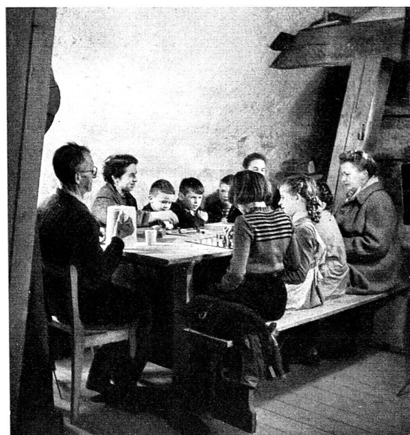
Il est important d'occuper et de distraire chacun.

Il est juste d'admettre cependant que les troupes militaires de la protection antiaérienne seraient un puissant soutien pour la protection civile. Le nombre de ses unités, leur effectif en officiers, sous-officiers et soldats bien préparés, permettraient à cette troupe de faire beaucoup en faveur de notre population en cas de guerre. Elle serait engagée là où les dégâts seraient les plus grands et où les organismes civils locaux