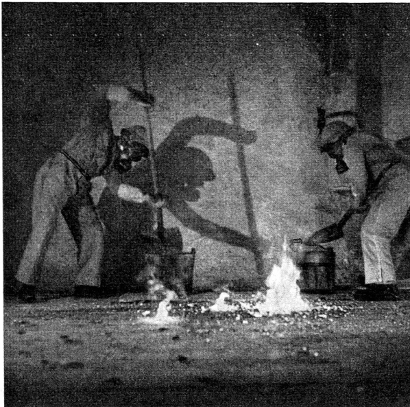
Une bombe incendiaire est recouverte de sable.