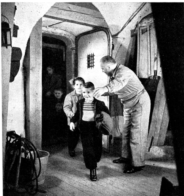
Les habitants de l'immeuble se rendent dans l'abri.

dans les nouveaux bâtiments et lors de transformations importantes dans les caves d'immeubles. Grâce à cette obligation, environ 18 000 nouveaux abris ont pu être construits jusqu'à présent, offrant une protection à 350 000 personnes. Les anciens abris du temps de guerre existant encore offrent une protection supplémentaire à environ 250 000 personnes. Ces installations sont encore loin de suffire aux besoins éventuels. C'est pourquoi l'Assemblée fédérale avait pris un arrêté, le 28 mars 1952, prévoyant l'obligation de construire des abris dans tous les immeubles des localités de plus de 2000 habitants. Un referendum ayant été lancé contre cette décision, celle-ci fut rejetée à une forte majorité par le peuple, le 5 octobre 1952. Le résultat négatif de cette votation populaire découragea ceux qui se préoccupent de la protection des civils et retarda l'organisation des nouvelles mesures de protection.