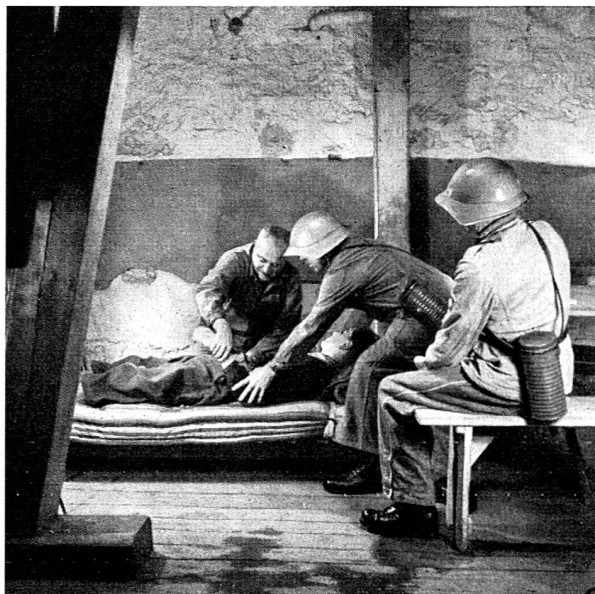
On soigne les blessés.

Le projet part de l'idée que chacun est responsable de sa protection, de celle de sa maison, de son entreprise, etc. C'est pourquoi, dans chaque localité d'au moins 1000 habitants, il faut créer des gardes d'immeubles , et, dans toutes les entreprises occupant 50 personnes et plus, des organismes de protection de l'entreprise . De plus, dans toutes les localités de 1000 habitants et plus, des organismes locaux de protection viendront renforcer l'organisation de base. Les organismes de protection civile comprendront les services suivants: alarme, obser-