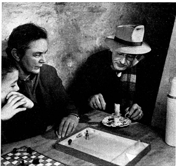
Mais attention, interdit de fumer et d'utiliser des lumières à flamme libre!

La loi devra trancher une question primordiale: jusqu'où l'obligation de servir pourrait-elle être étendue? Il ne devrait y avoir aucune hésitation quant à l'obligation de servir dans les gardes d'immeubles pour tous les occupants d'un immeuble, à l'exception des enfants, des vieillards et des malades. Dans les organismes d'entreprises, il paraîtrait normal que tous ceux qui y travaillent, y compris les femmes, soient obligés d'en faire partie. Par contre, la question de l'obligation pour les femmes de s'engager dans les organismes locaux de protection civile ou, au contraire, la faculté pour elles de s'engager volontairement sont en discussion. Personnellement j'estime que nous devrions nous contenter d'un engagement volontaire et qu'il serait faux d'étendre trop loin l'obligation imposée aux femmes (en ce qui concerne les hommes, l'obligation de servir ne se discute pas). N'oublions pas que les obligations militaires ne s'étendent pas aux femmes et que les droits civiques leur sont encore refusés.