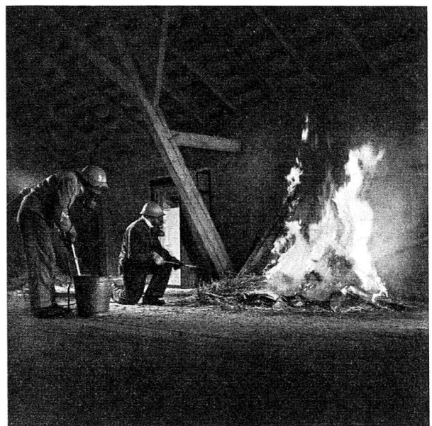
On lutte contre l'incendie avec des extincteurs et des seringues.