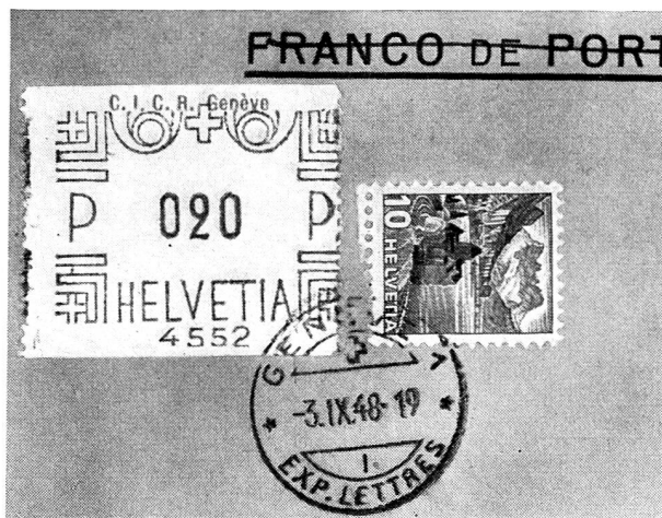
Un affranchissement du C. I. C. R. (Etiquette pour machine à affranchir M. 2 de notre catalogue croix-rouge).

Le nouveau règlement des Postes de 1910 mit fin à ce régime libéral. Il instituait, dès le 1 er janvier 1911, des timbres de bienfaisance de franchise de port, destinés aux œuvres dont le but charitable ou social était reconnu. Ces timbres, d'une valeur d'affranchissement respective de 2, 5 et 10 centimes, étaient remis gratuitement à ces œuvres à concurrence d'un montant de fr. 3.— par an et par lit pour les établissements hospitaliers, de fr. 3.— par an et par enfant pour les orphelins et les asiles, de 25 centimes par enfant pour les colonies de vacances. L'attribution totale ne pouvait