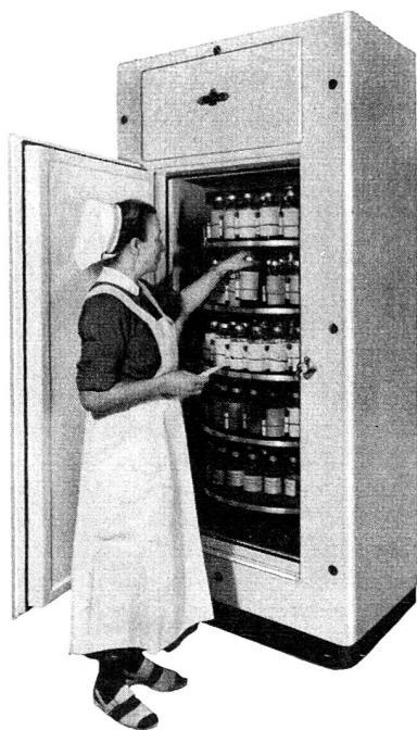
Armoire frigorifique spéciale pour la conservation du sang

Frigidaire REFRIGERATION ET CLIMATISATION AUTOMATIQUE MARQUE DÉPOSÉE PRODUIT DE GENERAL MOTORS