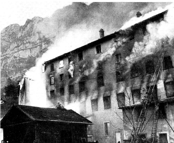
Le tragique incendie de Riedern.

A la Croix-Rouge autrichienne de Linz: 5779 kg de literie, ustensiles de ménage, pour une valeur de fr. 34 537.—;