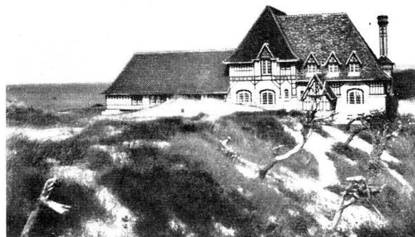
La belle colonie de Cabourg.