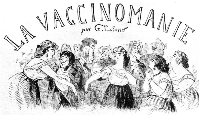
La vaccination mise à la mode excita la verve des caricaturistes de l'époque romantique. On avait oublié déjà les ravages causés par la maladie jusqu'à quelques années plus tôt.