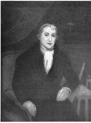
Le Dr Ed. Jenner, qui découvrit la vaccine, 1749-1823

commune, variole confluyente, variole hémorragique, variole fruste, varioloïde, variole compliquée sont autant de formes cliniques qui ont retenu l'attention des médecins.