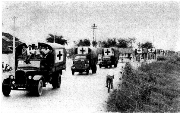
Une colonne de 46 camions porte des secours aux réfugiés dans le Sud-Vietnam.

Une des dirigeantes du Bureau de la Croix-Rouge de la Jeunesse de la Ligue des sociétés de la Croix-Rouge