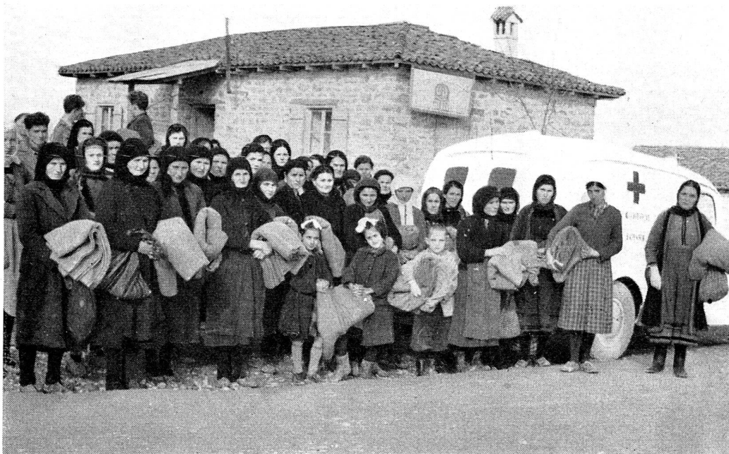
Trois cents couvertures de laine envoyées par la Croix-Rouge suisse ont pu être distribuées dans le nord de la Grèce. Voici la remise, à Kozani, le 20 décembre, des couvertures suisses à des mères de famille, dont beaucoup sont veuves, par la Croix-Rouge hellénique.

La sezione ha organizzato nel 1955 la colletta e la vendita di distintivi in tutto il Mendrisiotto. Causa malattie e interventi chirurgici furono aiutate alcune famiglie bisognose che fecero appello alla Croce Rossa.