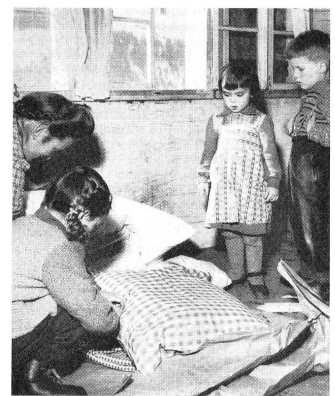
Que de travail pour débarrasser ces richesses et se persuader qu'elles sont à vous!

Le dégel qui a provoqué, au début de mars, des inondations dans le nord de la France qui ont causé de gros dégâts, a produit aussi de graves glissements de terrain en Italie dans la province de Teramo, dans les Abruzzes, où trois villages ont été détruits et les cultures ravagées. Il en a été de même dans bien d'autres pays, en Autriche notamment, et surtout en Hongrie où trois villes et douze villages au sud de Budapest ont été inondés et 100 000 personnes évacuées. Le 16 mars, la Ligue a adressé une offre d'entraide internationale à la Croix-Rouge hongroise en faveur des sinistrés.