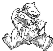
Marque à l'Ours