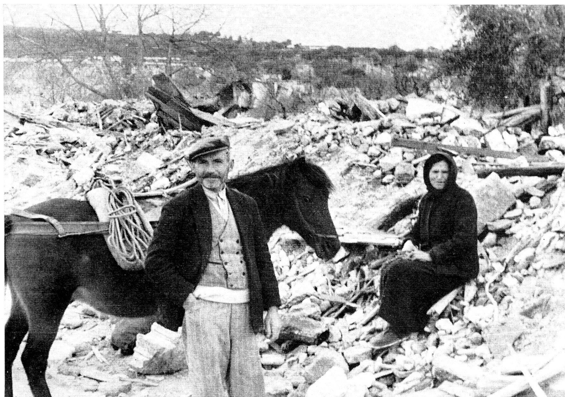
Le Nord de la Grèce a été ravagé par la guerre.

Une cinquantaine d'enfants réfugiés venant du Sleswig-Holstein sont arrivés en Suisse le 1 er décembre et ont été accueillis pour trois mois dans des familles suisses. Au mois de janvier ce sera le tour d'un autre groupe de 50 enfants réfugiés provenant de la Haute Autriche.