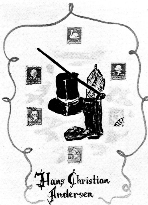
Une page de l'album de timbres danois: les timbres commémoratifs d'Andersen.