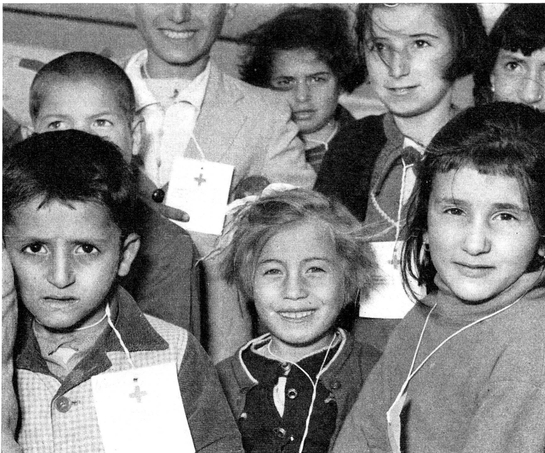
Un groupe des enfants grecs soignés au préventorium « Beau-Soleil » de la Croix-Rouge suisse à Gstaad lors de leur débarquement à Genève.