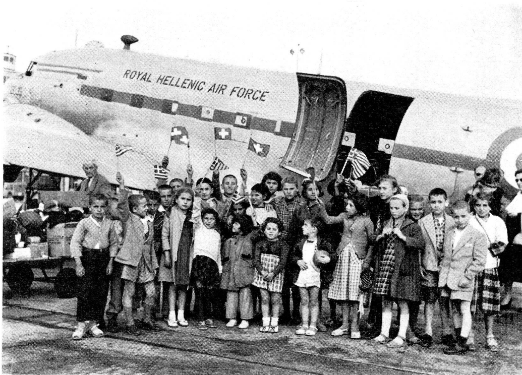
L'arrivée à l'aéroport de Genève du premier avion militaire amenant les enfants grecs en Suisse.

M. Haug a fait une conférence ayant pour thème « La misère en Grèce; l'aide apportée à ce pays » lors de l'assemblée générale de la section zuricoise de la Croix-Rouge suisse, le 6 juin.