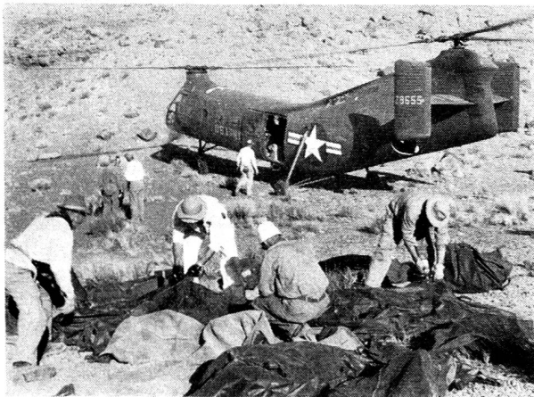
Les sauveteurs de la Garde aérienne ont ramené les corps des victimes sur le plateau où ils ont établi leur camp.