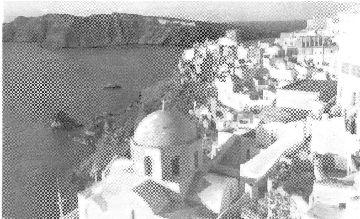
Thira, principale localité de l'île de Santorin ravagée par le tremblement de terre du 9 juillet.

Un des plus tragiques accidents que l'aviation ait eu à enregistrer depuis sa naissance, survenait le 30 juin dans une des régions les plus sauvages et les plus désertiques de l'Amérique du Nord, le Grand Canyon, dans l'Arizona. Deux appareils de transport civils, un Douglas DC-7 et un Super-Constellation, entraient en collision et s'écrasèrent entraînant dans la mort équipages et passagers. On ne devait retrouver que des débris informes des appareils et les corps déchiquetés des 128 victimes de cette catastrophe de l'air.