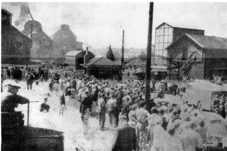
La catastrophe de Marcinelle, devant l'entrée de la mine.

A la suite des graves inondations qui ont ravagé l'Iran, la Ligue des sociétés de la Croix-Rouge avait lancé, le 3 août, un appel international en faveur des sinistrés.