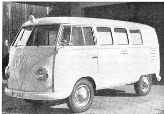
La nouvelle ambulance d'Airolo.

Vingt-trois enfants diabétiques, d'âge scolaire, venus de toute la Suisse romande ont été appelés à participer à ce camp. L'on s'était volontairement arrêté à ce chiffre peu élevé, car il s'agissait d'un camp pilote dont les expériences auraient une grosse importance pour l'avenir. La direction du camp a été confiée à un médecin qu'assistait un moniteur-chef diplômé du Centre d'entraînement aux méthodes d'éducation active. Des médecins, des infirmières, des moniteurs et des monitrices complétaient le personnel d'encadrement et de surveillance médicale. Le résultat a été si concluant qu'un camp rassemblant un plus grand nombre d'enfants est d'ores et déjà prévue pour l'an prochain.