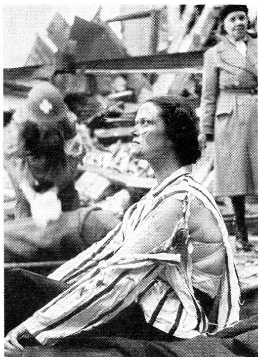
Les exercices d'entraînement de protection aérienne sont faits en Suède avec un réalisme dont cette photo donne un exemple.

La guerre est en fait un objet du droit des gens . Au cours des cent dernières années, de nombreux accords internationaux ont été rédigés et ratifiés, dans le but de mettre des bornes à la cruauté et au déchaînement de la guerre. Les puissances qui, en 1864, ont signé la « Convention de Genève pour l'amélioration du sort des blessés dans les armées en campagne » étaient « animées du désir d'adoucir les maux inséparables de la guerre, de supprimer les rigueurs inutiles et d'améliorer le sort des