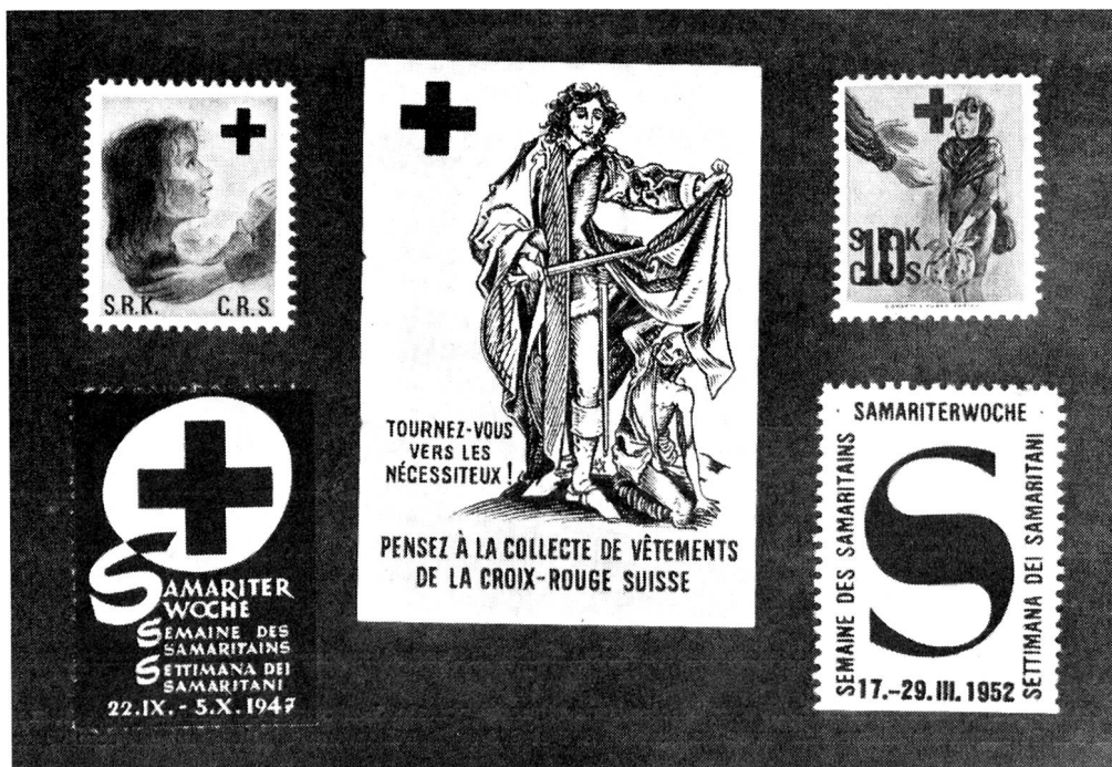
En haut: Vignettes croix-rouge V. 2, V. 3 et V. 1. En bas: Vignettes samaritaines V. 1 et V. 3.

II. — Timbres avec surtaxe au bénéfice d'œuvres s'occupant des infirmières (S)