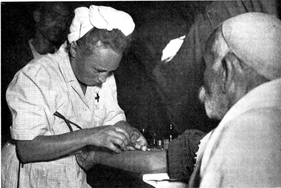
Une infirmière du Comité international de la Croix-Rouge pansant un réfugié arabe.

Le nombre de médecins et d'infirmières qui participent à nos missions médico-sociales varie selon les