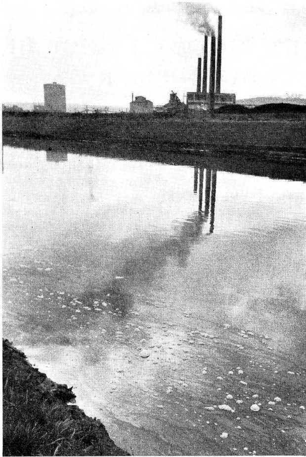
Rivière polluée par des déchets industriels.

Les trouver dans une eau, c'est montrer que celle-ci pourra, éventuellement, contenir les germes pathogènes les plus redoutables. (Buttiaux)