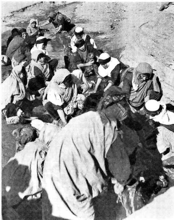
Dans ce village d'Iran, l'eau de l'unique canal alimentant la région sert à tout et est un danger constant pour la santé publique. Pour être moins apparente, la pollution de nos eaux n'est pas moins patente.

Or, la mise en évidence de ces divers agents pathogènes dans les eaux présente le plus souvent des difficultés insurmontables. C'est pour ces raisons qu'on ne recherche pas les espèces pathogènes, mais celles que l'on rencontre toujours dans les eaux, lorsque celles-ci sont polluées par des déjections humaines ou animales, à savoir le colibacille (Escherichia Coli), l'entérocoque (Streptococcus faecalis), le Clostridium perfringens. Ces trois espèces constituent les témoins incontestés des contaminations fécales: