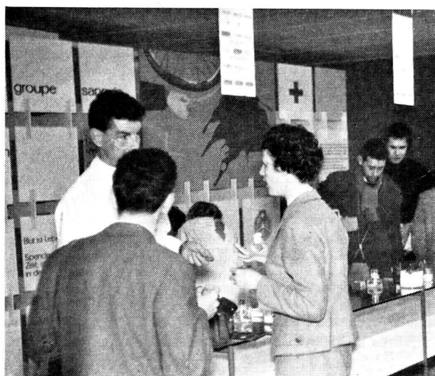
Le stand de transfusion au Salon de l'automobile.

A l'occasion du Salon de l'automobile qui s'est tenu à Genève du 14 au 24 mars, le Touring-Club de Suisse et le service de transfusion de la Croix-Rouge suisse ont, à titre d'essai, organisé en commun un stand de propagande en vue de rendre les visiteurs du Salon attentifs à l'importance de connaître leurs groupes sanguins et leurs facteurs rhésus. Deux laborantines procédaient à la détermination des groupes sanguins en utilisant à cet effet les sérums-tests employés pour ces examens. Elles communiquaient d'emblée le résultat de leurs recherches aux intéressés sur une petite carte