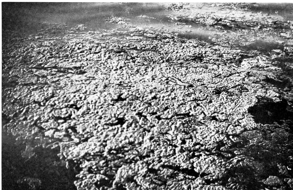
L'abondance de mousses malodorantes envahissant en été la surface du lac est un autre témoignage de la pollution croissante des eaux. Photo prise à proximité immédiate de bains publics.

L'avenir de la santé de l'eau, tout court, en dépend, comme aussi l'avenir de la santé de toute la population de nos cantons.