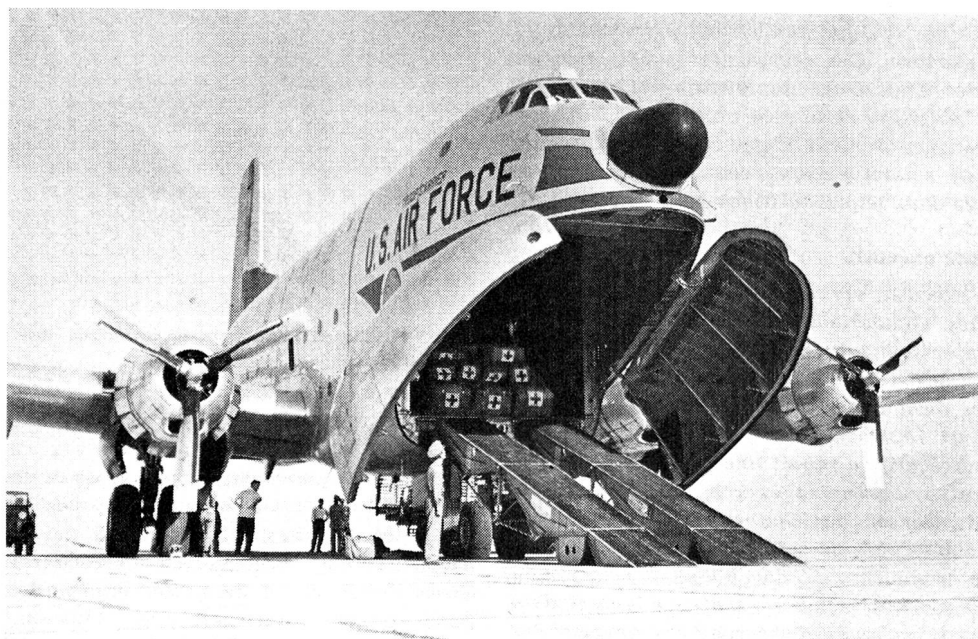
La Croix-Rouge internationale au service des sinistrés. — Aide à l'Iran en août 1956.

En 1946, au lendemain de la seconde guerre mondiale, les circonstances ont amené le Conseil des Gouverneurs à proclamer une véritable charte de la Croix-Rouge non écrite jusqu'alors, sous la forme de principes fondamentaux.