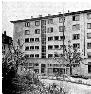
Le nouveau Foyer qui occupe les quatrième et cinquième étages du 31 de l'avenue Vinet.

Le 10 juillet, à l'hôpital de Sursee, vingt nouvelles recrues infirmières, samaritaines, spécialistes et éclair-