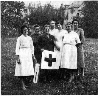
Les participantes du cours de Sion.