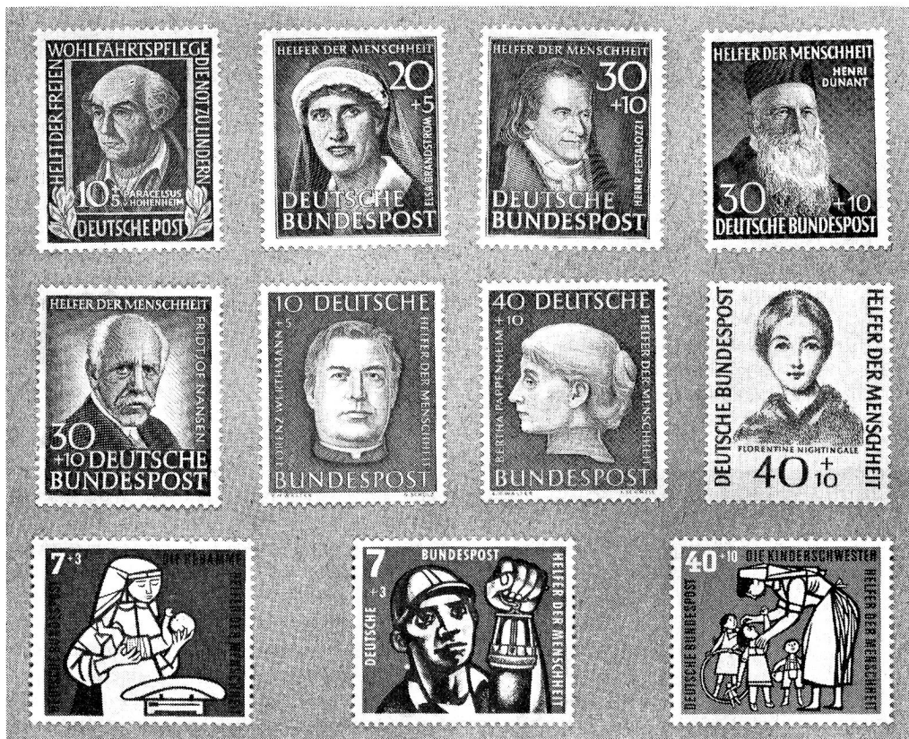
En haut: S. 2, S. 7, S. 8, S. 12; au milieu: S. 16, S. 18, S. 20, S. 24; en bas: S. 29, S. 25, S. 28.

Il convient donc de remplacer, pour la République fédérale allemande, au chapitre des timbres avec surtaxe au bénéfice de la Croix-Rouge, l'indication du timbre catalogué par nous S. 1 (Portrait d'Henri Dunant, 1952), par la liste suivante comprenant tous les timbres des émissions ci-dessus.