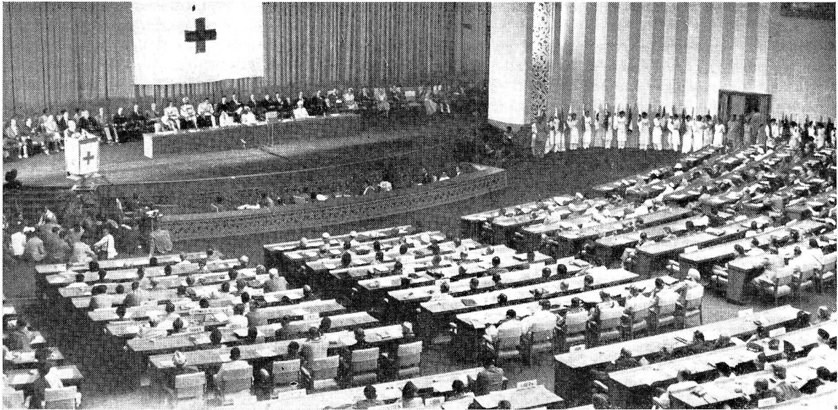
L'ouverture de la XIX e Conférence internationale, le 28 octobre 1957, au palais du « Vigyan Bhavan » à la Nouvelle-Delhi. L'assemblée écoute le discours de S. Exc. M. François-Poncet.