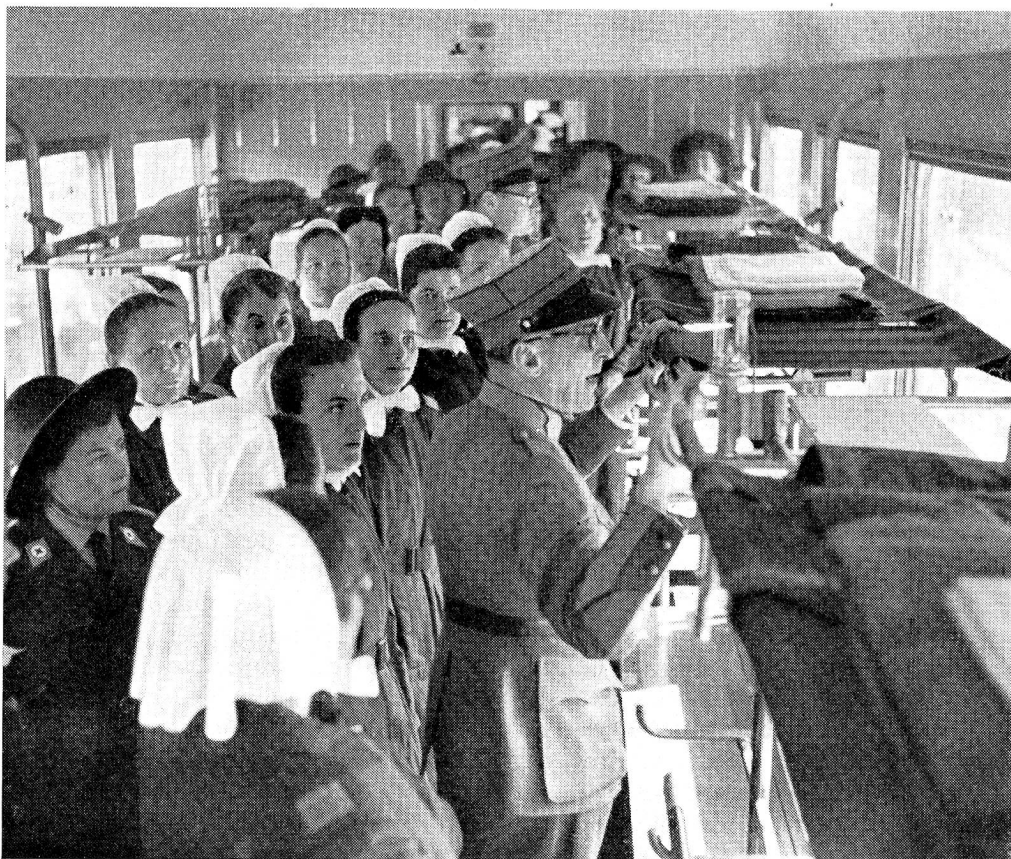
Infirmières d'un détachement croix-rouge dans un wagon d'un train sanitaire.

au terme de leur voyage, c'est-à-dire à proximité d'un ESM, les patients sont pris en charge par les ambulances et voici qu'entrent en scène les SCF conductrices, stylées, parfaites, aussi à l'aise au volant de leur ambulance qu'à celui de la plus coquette trottinette, qui habilement, doucement, installent les blessés dans leurs voitures et plus doucement encore repartent en direction de l'ESM.