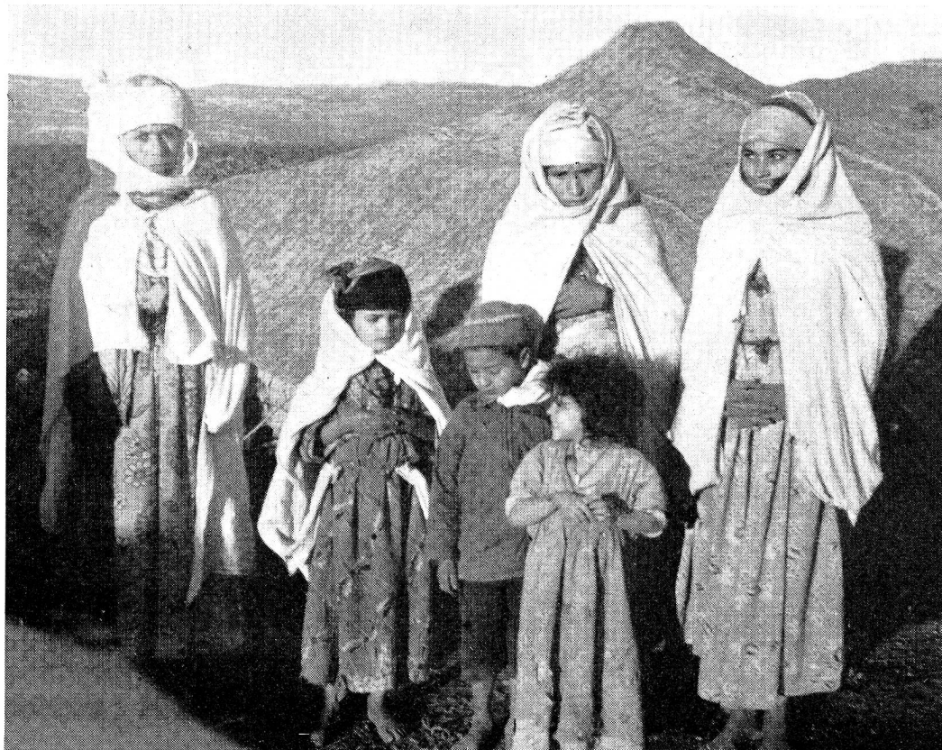
Des femmes aux beaux visages et aux yeux brillants...

courtoisement, non sans une certaine méfiance grave. Parfois un beau sourire illuminait ces visages, surtout chez les jeunes femmes chargées d'enfants, lorsque l'interprète leur disait que peut-être nous leur apporterions quelque chose pour eux. Elles demandaient parfois si on leur donnerait aussi des robes? Cependant les femmes dans leurs grands tissus de coton multicolore, la tête recouverte de fichus blancs, semblaient moins misérablement vêtues que les enfants, pitoyablement accoutrés de vieilles vestes, de chandails troués ou de tissus-éponge. Parfois l'une ou l'autre de ces femmes dont on nous