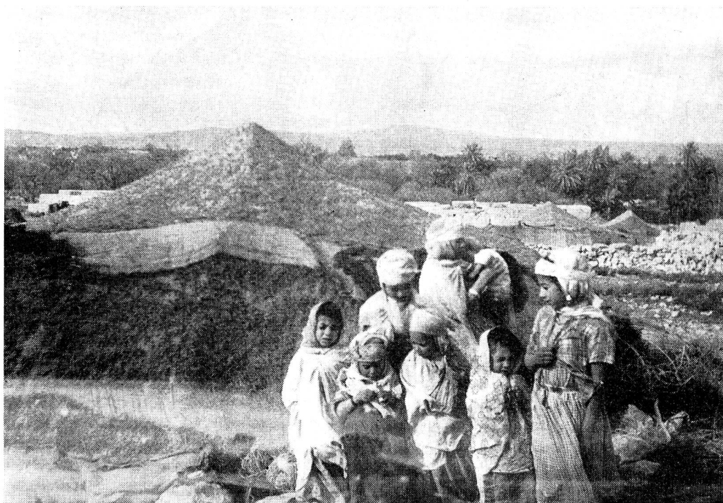
Des grappes d'enfants devant les tentes...

Je me demandai ce que l'on pourrait bien faire avec le premier subside de 10 000 francs suisses dont la Croix-Rouge suisse m'avait dit pouvoir disposer au début. Cela ne serait qu'une goutte d'eau dans la mer. Mais je me mis aussitôt à ma tâche d'information. Mon premier soin fut de m'adresser aux autorités locales marocaines, car il me semblait que c'était avec elles avant tout que la Croix-Rouge devait collaborer. Par l'entremise du secrétaire-général du gouverneur de la Province d'Oujda, je pris contact avec le médecin-chef du Service de santé de la