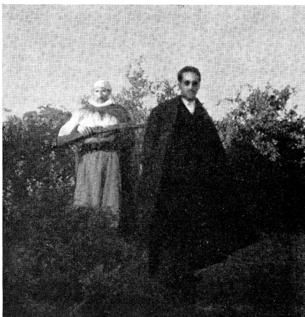
Le caïd du lieu, accompagn  de mokhrazni, sa garde arm e...

Apr s beaucoup de visites et des pourparlers avec le Service de la sant , j'obtins la conviction qu'il fallait aider dans la mesure de nos moyens et, persuad e que la population suisse ne resterait pas indiff rente au sort de ces enfants, je d cidai de leur consacrer enti rement l'aide qui pourrait  tre octroy e; j'envoyai   Berne rapports et photos. Les autorit s marocaines d ci-