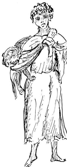
Une fillette arabe porte son petit frère à la mode de chez elle

Enfin en novembre toute une bande de territoire algérien, en face de Saïdia, au sud de Boubeker, était évacuée à bref délai et déclarée zone interdite sur 10 km de profondeur. Plus de 10 000 Algériens furent refoulés alors sur le Maroc où ils trouvèrent refuge. En juin 1957, comme il en était arrivé encore en grand nombre durant l'année, on comptait environ 50 000 ré-