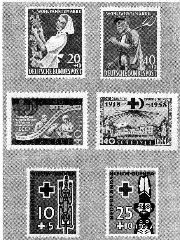
En haut: Allemagne, bienfaisance; au milieu: U. R. S. S., 40 e anniversaire des Croix- et Croissants-Rouges soviétiques; en bas: Nouvelle-Guinée néerlandaise.

Le Journal philatélique de Berne reproduit les nouvelles dispositions prises par les Postes turques le 9 juin 1958 pour les timbres à surtaxe émis notamment en faveur du Croissant-Rouge :