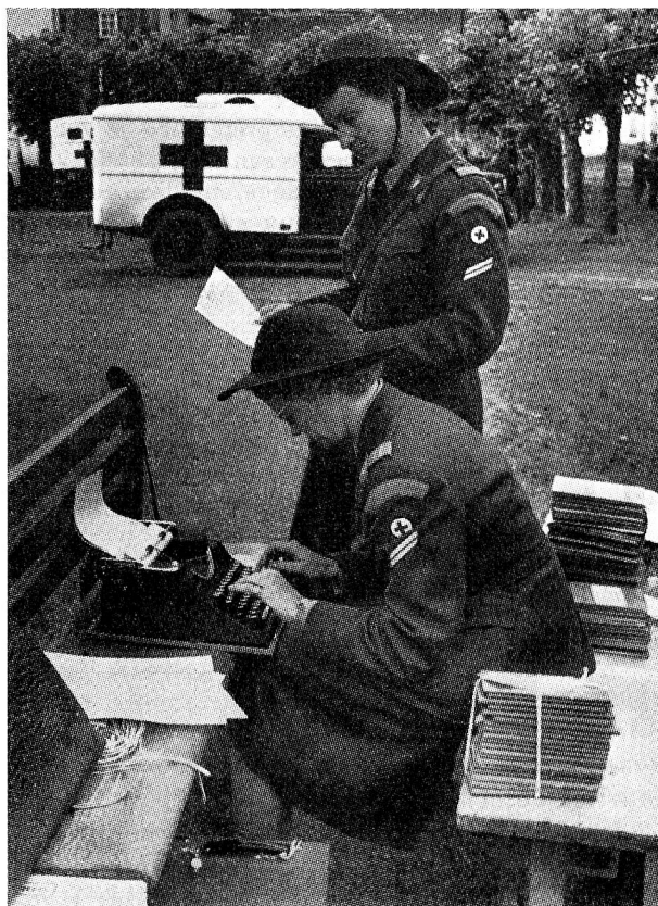
Deux chefs de détachement d'une formation croix-rouge inscrivent les résultats de l'examen radiologique dans les livrets de service.

D'autre part, la Croix-Rouge suisse doit s'adresser aux samaritaines , aux spécialistes et aux éclaireuses susceptibles d'entrer dans ses détachements pour leur faire comprendre la nécessité de se mettre dès à présent à disposition. Car les soins aux blessés et aux malades ne s'improvisent pas. Si l'on veut que nos malades et nos blessés, en cas d'urgence, puissent recevoir dans les formations appropriées les soins qu'ils appellent, c'est dès maintenant qu'il faut que ces détachements puissent être constitués et préparés à leur tâche. Lorsque survient une catastrophe, la Croix-Rouge suisse reçoit chaque fois une quantité d'offres de volontaires souhaitant se dévouer et venir en aide aux victimes, elle en reçoit même infiniment plus qu'elle n'en a besoin. Mais ces dévouements de la dernière heure, si touchants, si précieux soient-ils, ne peuvent remplacer auprès de malades ou de blessés le travail efficace et bien coordonné de formations composées de personnes préparées à cette tâche et à cette collaboration. Pour assurer la sécurité des nôtres, soldats ou civils, en cas de sinistre, de catastrophe, peut-être de guerre, nous devons être prêts dès maintenant. Il est donc indispensable que l'effectif nécessaire de spécialistes, de samaritaines et d'éclaireuses soit atteint dans nos détachements aussi rapidement que possible.