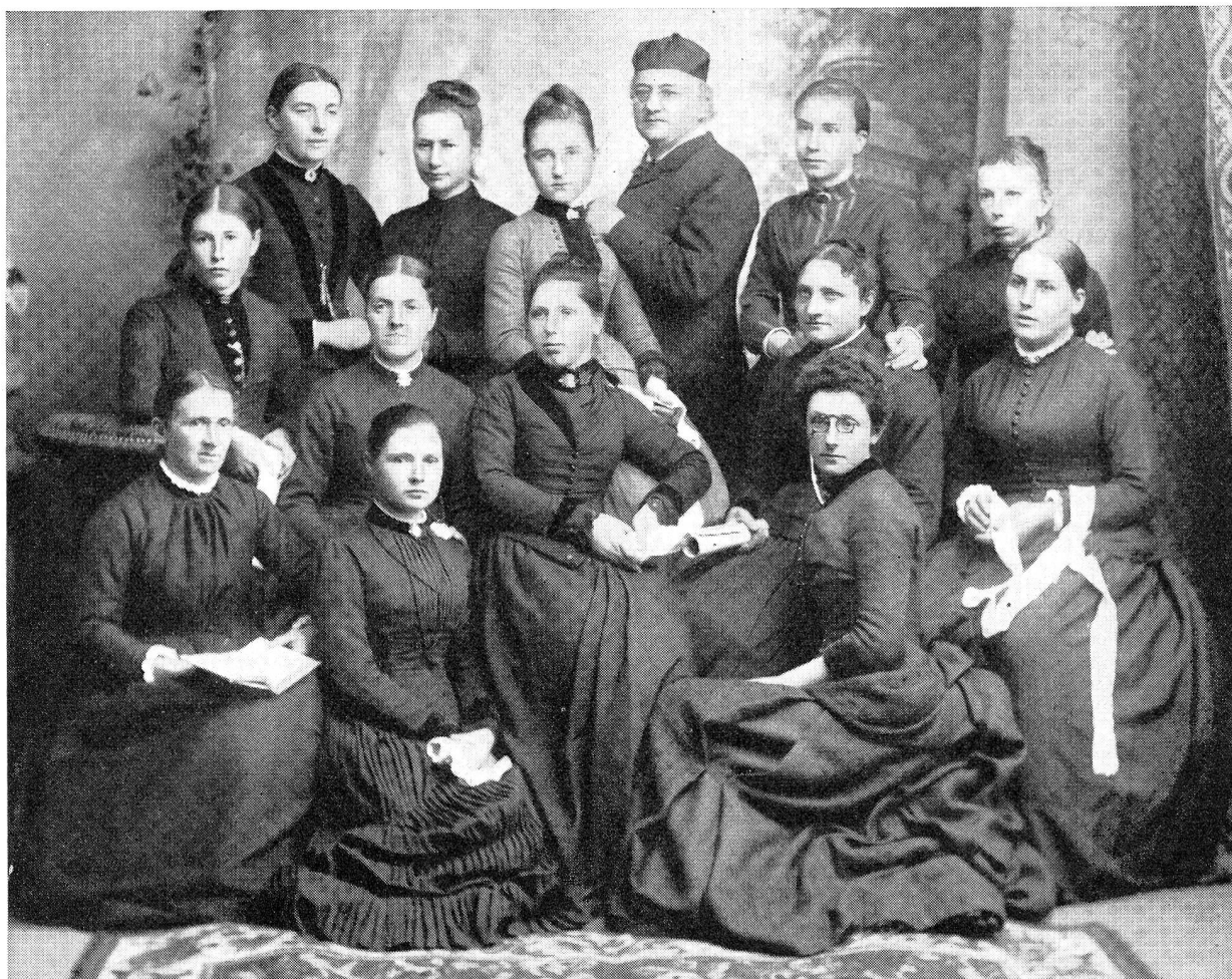
Sourciennes de jadis: une volée d'élèves de « La Source » au temps du pasteur Reymond.

« à peu près », mais à peu près seulement où loge M lle L., la « vieille tante », on finit bien par arriver devant une maison. Pas d'étiquette, pas de sonnette. La porte, une solide porte de chêne résiste. Une tête émerge d'une fenêtre: « La vieille M lle L... c'est là, à cette fenêtre, tout en haut, à gauche. » Encore une porte, encore un escalier. Nous y voici. « Entrez, entrez que voulez-vous? » Elle est toute surprise, mais nous accueille avec la plus grande amabilité, nous faisant les honneurs de « son » fauteuil, voulant absolument se contenter, elle, de la chaise. Certes, elle est âgée M lle