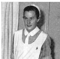
Une nouvelle sœur à ses « anciennes ».

Les « nouvelles », en activité à ce jour, sont 750 : 600 exercent leur profession en Suisse, 120 à l'étranger. Elles travaillent dans les services hospitaliers, les œuvres médico-sociales, les services privés, auprès de médecins. Vingt-cinq d'entre elles sont missionnaires. Mais en cent ans, La Source a délivré 2719 diplômes. Que sont-elles donc devenues toutes ces « Sœurs » changées plus tard en « Sourcières » ? Beaucoup sont décédées, nombreuses sont celles qui se sont mariées, qui ont quitté la profession. Mais il existe encore des « anciennes », qui ont maintenant 70, 80, 89 ans... Celles des volées 1888, 1892, 1901... Celles du temps où les « études » duraient cinq mois, huit mois.