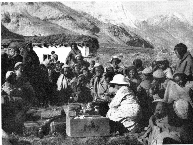
Une infirmière de La Source missionnaire au Tibet.

fiance aussi en mon diplôme suisse. J'acceptai sa proposition.