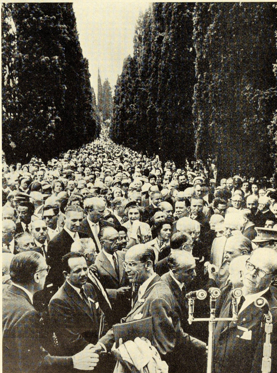
Solferino, 27 juin 1959. — La foule massée devant le Mémorial au long de l'avenue de cyprès.