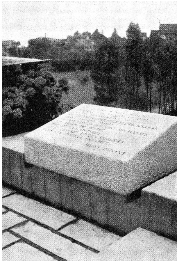
Sur un bloc de marbre, à l'entrée du monument, une phrase tirée du «Souvenir de Solferino» rappelle l'œuvre et le nom d'Henry Dunant.

« Malgré l'extension de notre mouvement, malgré le grand nombre de ses membres, malgré tout ce qui a déjà été accompli, il reste encore beaucoup à faire. Il y a beaucoup de misère,