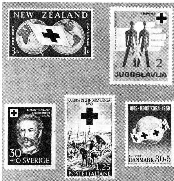
En haut: Nouvelle-Zélande; Yougoslavie. En bas: Suède (S. 1); Italie (T. 1); Danemark (S. 8).

1959 1 centavo Portrait de H. Dunant et croix rouge. « Jean-Henry Dunant - Commemorativas de la Cruz Roja ». Bleu/rouge.