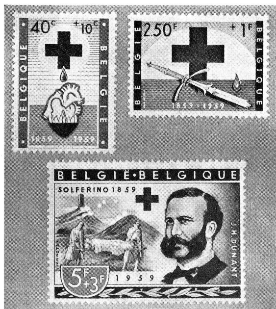
Belgique, S. 44, 47 et 49.

Signalons une oblitération (circulaire, rouge) à l'occasion d'une Exposition philatélique à Sopron: « 100 Eves a Vöröskereszt Eszeje — 1859—1959 — Június 24 » et croix rouge.