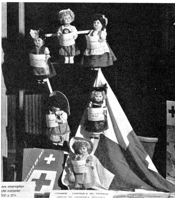
Une jolie vitrine dans une banque de Genève à l'occasion de la vente de mai.

L'Alliance des samaritains a tenu à Bâle les 13 et 14 juin sa 71 e assemblée générale ordinaire.