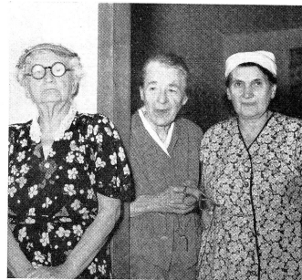
Destini che si incontrano. Dalla Russia son partite per vie diverse per giungere a Grono dopo anni di peregrinazioni. La gran signora che parla quattro lingue, discende di letteratura, e aiuto gli altri profughi quale interprete e segretaria, la donna di casa che ha fatto l'odissea dei campi di raccolta in Italia, la guardiana di una chiesa ortodossa, in Cina, per più di quarant'anni e giunta qui negli ultimi giorni. Le unisce la lingua e il ricordo della patria perduta. — Partes jadis de Russie, ces trois réfugiées ont vu leurs destins se rencontrer à Grono. L'une d'elles a vécu l'odyssée des camps de réfugiés en Italie, l'autre vécut en Chine plus de 40 ans, gardienne d'une église orthodoxe, la première, qui parle quatre langues, sert d'interprète et de secrétaire à ses compagnes.