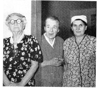
Destini che si incontrano. Dalla Russia son partite per vie diverse per giungere a Grono dopo anni di peregrinazioni. La gran signora che parla quattro lingue, discende di letteratura, e aiuto gli altri profughi quale interprete e segretaria, la donna di casa che ha fatto l'odissea dei campi di raccolta in Italia, la guardiana di una chiesa ortodossa, in Cina, per più di quarant'anni e giunta qui negli ultimi giorni. Le unisce la lingua e il ricordo della patria perduta. — Partes jadis de Russie, ces trois réfugiées ont vu leurs destins se rencontrer à Grono. L'une d'elles a vécu l'odyssée des camps de réfugiés en Italie, l'autre vécut en Chine plus de 40 ans, gardienne d'une église orthodoxe, la première, qui parle quatre langues, sert d'interprète et de secrétaire à ses compagnes.