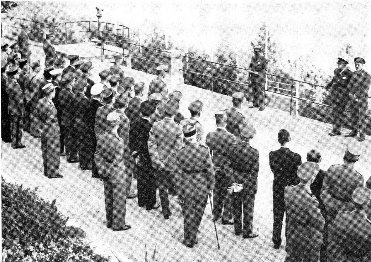
Les médecins militaires rassemblés sur la terrasse de Macolin.

Le programme était chargé: trois allocutions et dix-neuf conférences à entendre en six jours; la visite des installations souterraines de l'Armée pour la préparation de plasma sanguin à Zweilütschinen, celle du C. I. C. R., de la Ligue et de l'O. M. S., à Genève, celle encore d'une école de recrues sanitaires; d'autres encore. Puis n'oublions pas, puisqu'il est connu que les âmes saines se trouvent dans des corps sains, que vous avez, Messieurs les médecins militaires, à vous ébattre chaque jour en trainings marine et en cuissettes bleu-pâles sur les pelouses de velours de Macolin, quels que soient votre âge, votre corpulence et votre degré d'entraînement... Sous la compétente direction des moniteurs pro-