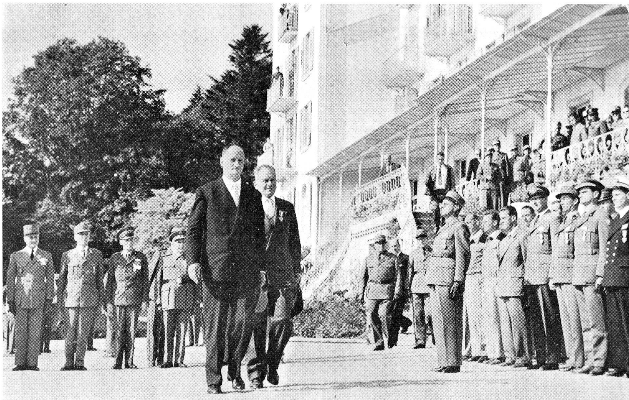
M. Paul Chaudet, président de la Confédération, inspecte le cours de Macolin.

« J'ai présenté un travail à la manière de « ce que » tout jeune médecin devrait être ou savoir. Je n'ai pas évité l'écueil qui consiste à lui prêter tellement de qualités que vous devez vous en sentir ou froissés dans votre modestie ou accablés par tout ce qu'on attend de vous. Mais c'est bien parce que je les aime beaucoup, mes camarades médecins-militaires, parce que je les sais professionnellement longuement et bien