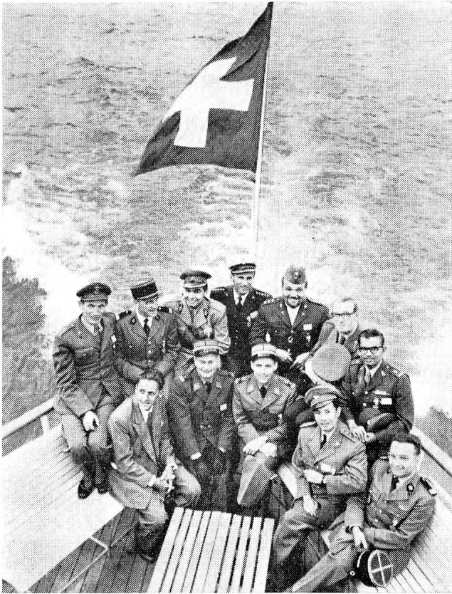
A l'ombre du drapeau suisse.