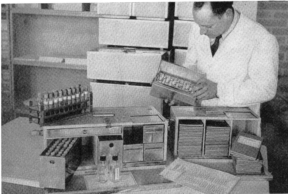
Le Laboratoire d'armée reçoit les échantillons de sang et les livrets de service des recrues.

l'on avait pris à tort un certain nombre d'« A » faibles pour des « 0 ».