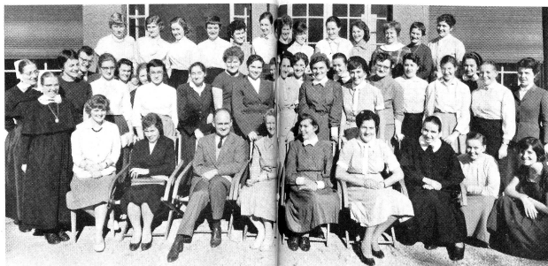
Le groupe des participants voyage « Henry Dunant ».