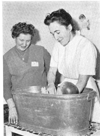
Ce n'est pas au Tessin, mais à Genève, à un cours de soins à la mère et à l'enfant qu'ont été prises ces images.

Si contano ormai a centinaia le donne ticinesi che han tratto profitto dall'innovazione. Per questo torniamo a parlarne, poichè i corsi di cure elementari a domicilio rientrano nell'azione di assistenza sociale alla popo-