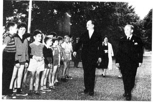
A Vaumarcus, le 1 er août, M. Chaudet, conseiller fédéral, est accueilli par les petits colons normands

sière et son aide, deux jeunes filles, tous français, avec un étudiant hongrois de Neuchâtel, constituaient les cadres — tous avaient entre 17 et 22 ans et ils ont formé une équipe magnifique. Et, comme jamais encore on n'avait vu à Vaumarcus, de si bons et entreprenants marcheurs, des enfants jusqu'à leurs moniteurs, les excursions ont été nombreuses. Tour à tour les enfants ont exploré les villages environnants, les Roches du Mont-Aubert, le Creux-du-Van, la Ferme Robert et les gorges de l'Arense — 8 h de marche pour les grands, les petits seuls ayant fait une part du trajet en chemin de fer. D'autres excursions les ont conduits à Chaumont et Valangin, à Morat en bateau, à Esta-