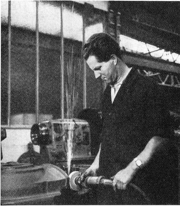
Aux usines Siemens, à Vienne, l'ingénieur de la sécurité a fait mimer par des ouvriers les principales causes d'accidents. Travailler au tour ou à la meule sans lunettes de protection = accident probable. (O. M. S.)

suffi qu'un seul de ces éléments eût été prévenu pour que l'accident ne se produisît pas.