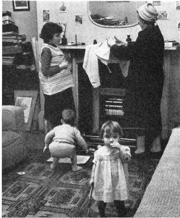
Les dangers domestiques. Une visiteuse d'hygiène, en Angleterre, montre à la mère le danger de mettre sécher des linges à proximité d'une cheminée (O. M. S.)

« Perdre du temps » à fermer un compteur électrique avant de changer un plomb, essuyer tout de suite une tache de graisse sur le carrelage de la cuisine, entrouvrir la fenêtre de la pièce où brûle un poêle à gaz ou à charbon: chacun de ces gestes élimine un des pièges qui empêchent la maison d'être pour tous ses habitants un véritable abri.