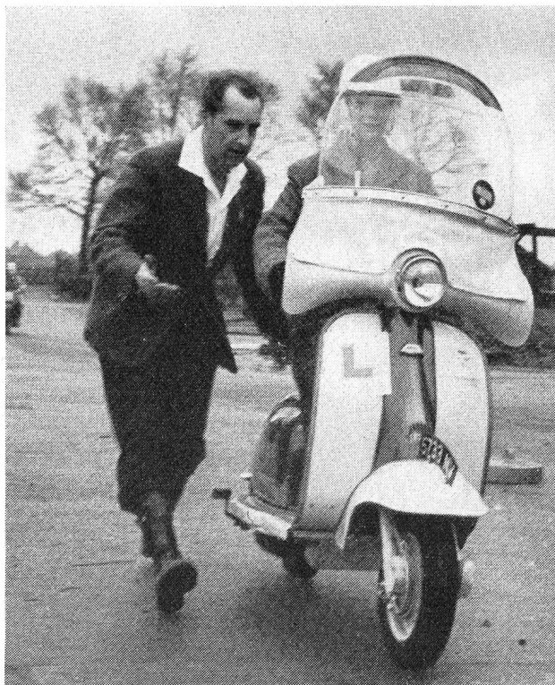
En Grande-Bretagne, l'on a poussé très loin le souci de l'éducation préventive des accidents. Témoin cette photo prise à l'école de conducteurs de scouts de la R. A. C. à Wembley.

Nous savons tous, combien les histoires terrifiantes peuvent se graver profondément dans le cerveau d'un enfant, tout prêt