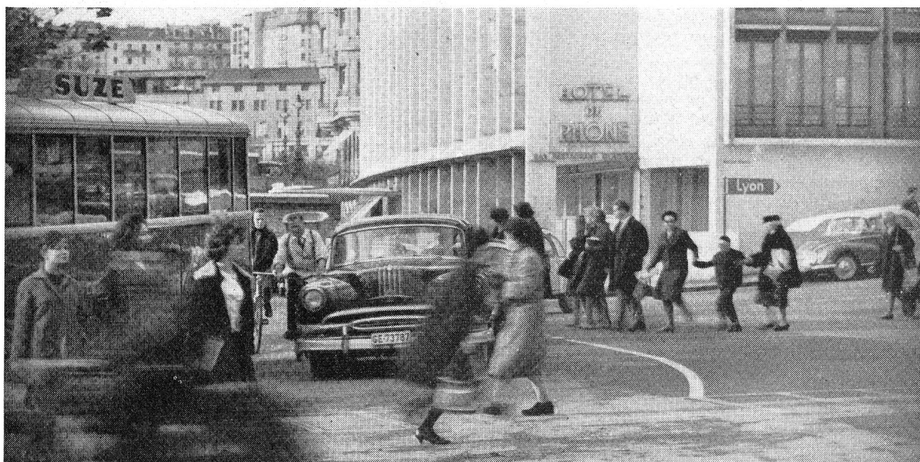
L'accident n'est pas accidentel... Il suffit pour s'en persuader de contempler l'ahurissante pétaudière causée par l'indiscipline commune des piétons, des cyclistes et des véhicules à moteur à un carrefour d'une de nos grandes villes romandes